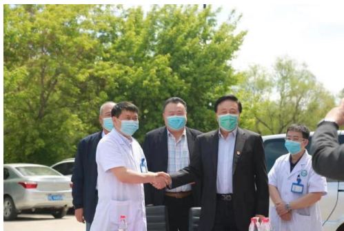
图3 学校领导到医院参观