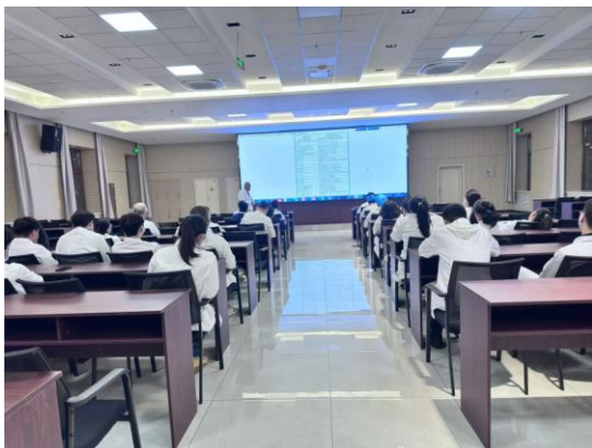
图 1 医院为实习生集中授课

等高端医疗专家、拥有优雅的住院环境、一流的康复器材（上、下肢康复机器人；截瘫康复机器人、上肢综合训练器）、先进的诊疗设备（西门子 1.5T 核磁、西门子 CT、法国 E 超、高压氧舱、NIPRO NCU-18 血液透析机/血滤机、德国卡特臭氧治疗机、德国威伐光-深度热疗机，瑞士 EMS 冲击波，美国索诺声神经、肌骨彩超、经颅多普勒、骨密度、动脉硬化检测、人体成份分析等），先进的“七绝八技”专项技术。康复科、针灸科、中医科、疼痛科、骨伤科、体检科、皮肤科是其重点科室。带教团队拥有正高级职称 15 人，拥有副高级职称 28 人，国家名老中医工作室 1 个，省级名老中医 1 人，省青年名中医 2 人。该院在临床实践和医学研究方面具有丰富的经验和专业知识。该院具有严格的考核制度，学生能够在带教团队的指导下全面提升临床技能和医学素养。