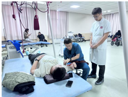
图 2 一师一徒带教学习