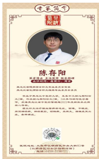
图 7、8 学校教师在大庆普济中医医院定期临床实践及带教工作