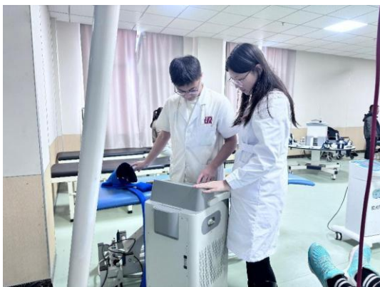
图5 带教老师教导学生使用康复器材