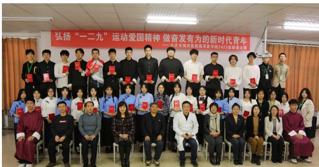
图 10 院校双方共同参加学生组织的活动