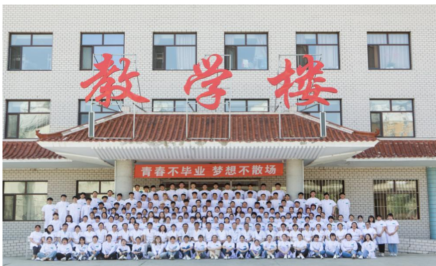
图 8 实习前临床教学医院师生在专业教学楼前合影

学校与临床医学院共建教学基地，建立教学组织机构，建立 7 个教研室及教学病区，建立集教学、宿舍、食堂兼具的专业教学楼，医院作为育人主体承担教学和管理任务。教学基地为理论授课、床边带教有机融合提供条件，为“双主体”育人模式提供基地支撑。