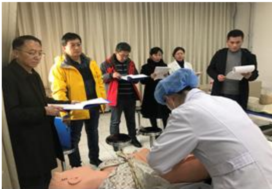
图 9 临床教师指导学生参加全国临床技能大赛

医院兼职教师担任学生全国技能大赛指导教师、实习前技能强化训练的指导教师、临床病例分析竞赛的评委，指导学生进行临床知识竞赛等，辅导员开展多种多样的主题活动，加强对学生的职业道德和爱国主义教育，全程参与育人。