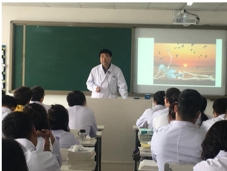
图 3 临床教学医院党委书记在讲授理论课

毕业实习 38 周，突出临床各科岗位能力训练；在社区医院和社区服务机构实习 2 周，提升基本医疗卫生服务能力。