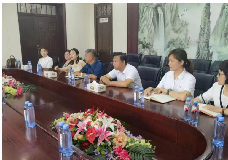
图 6 院校领导沟通人才培养座谈会