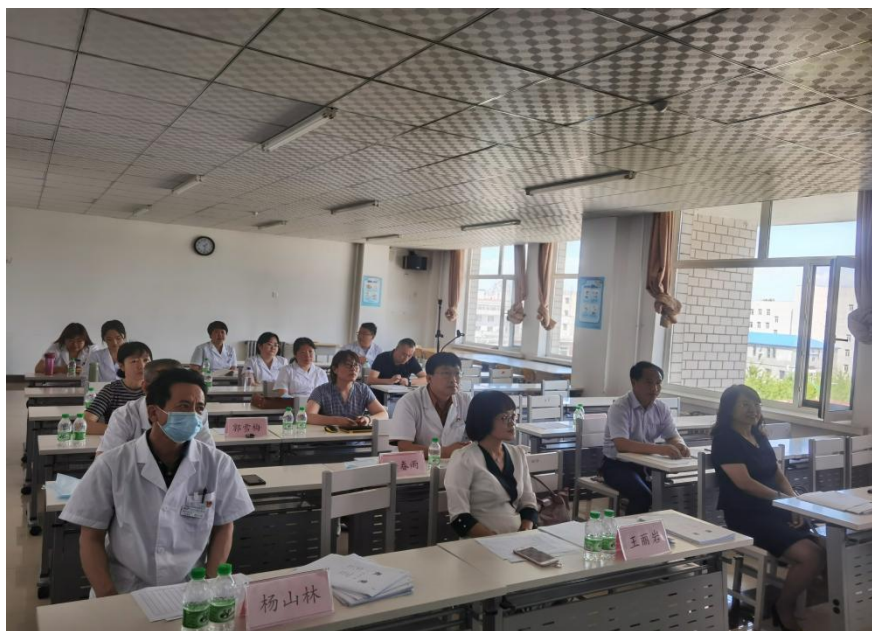
图1 校院组织进行新教师试讲

为加强临床教师的梯队建设，医院严把教师授课关，学校与医院专家共同组成评审委员会，对拟承担授课任务的新开课教师及开新课教师进行教研室及院校试讲活动，逐一讲评，由学校专业带头人做示范课，教务处副处长做总结讲评（图1、图2）。通过五次试讲，现有170余名临床医学院兼职教师积极参与到教学和育人工作中。学校推荐2名临床兼职教师参编人民卫生出版社十三五规划教材。