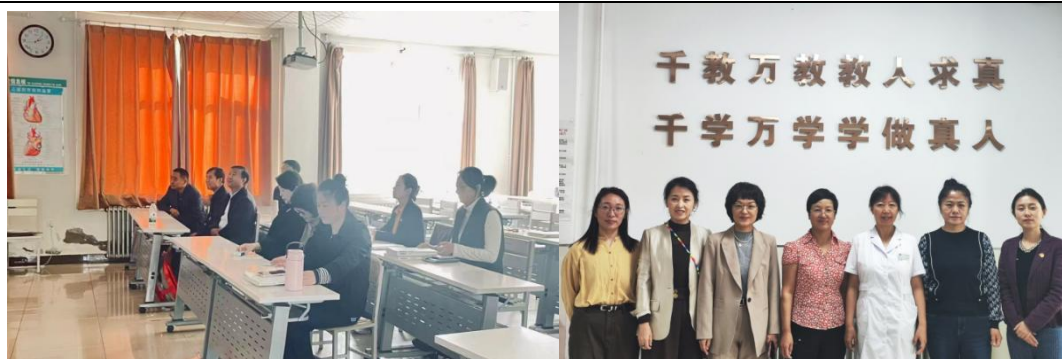
图 11、12 学校领导老师定期深入医院了解学生学习生活动态