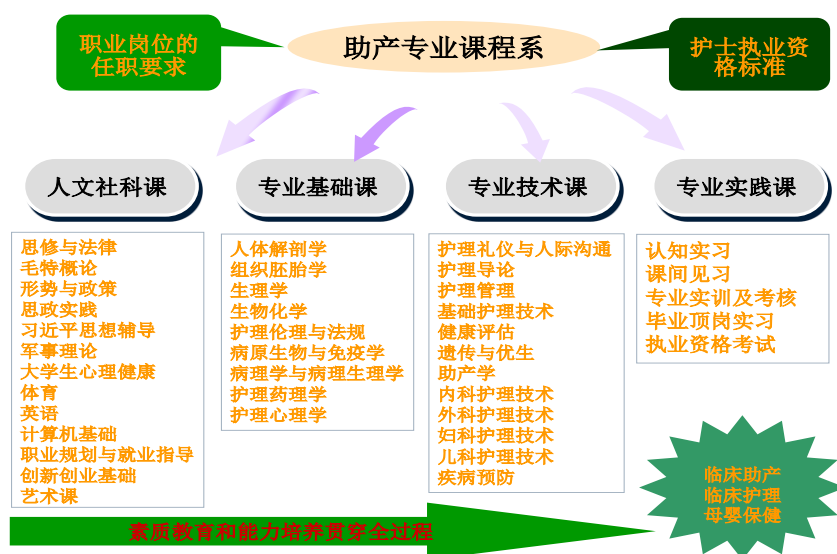
图1 助产专业课程体系模拟图

遵循学生的知识、能力发展规律，构建了包括人文社科课、专业基础课和专业技术课的理论教学体系。人文社科课增设了思政实践、习近平思想辅导、创新创业基础和艺术限选课等课程，同时进行思政课、艺术课和体育课等课程的教学改革，使这些课程贯穿于医学教育全过程，与医学学科相互渗透，培养学生的人文素养和职业道德；专业基础课充分体现以应用为目的，以“实用、够用”为原则，强调基本理论和基本知识，为专业课奠定基础；专业课根据岗位能力需要，以工作过程为导向，突出针对性和应用性，教学内容突出运用理论知识解决实际问题 and 培养实践能力，为了增加学生就业竞争力，增加了专业选修课。依据“理论-实践-再理论-再实践”的认知规律，按照能力、技能的形成过程，在学中做，在做中学，实施“认知实习-专业技能实训-课间实习-毕业毕业实习”理实交替的实践教学体系，加强理论与实践的深度融合，确保人才培养目标的实现。